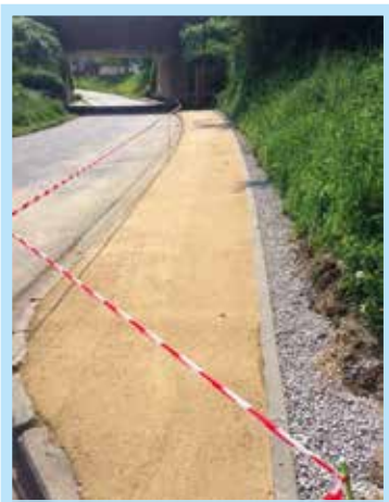
Etangs de Coeurcq : Aménagement du trottoir avec un revêtement perméable employant des matériaux purement écologiques. De par sa composition, il empêche la croissance des mauvaises herbes, ce qui vient parfaitement à la rencontre de la nouvelle législation concernant l'utilisation de pesticides. Il offre aussi une excellente résistance au ruissellement des eaux pluviales.