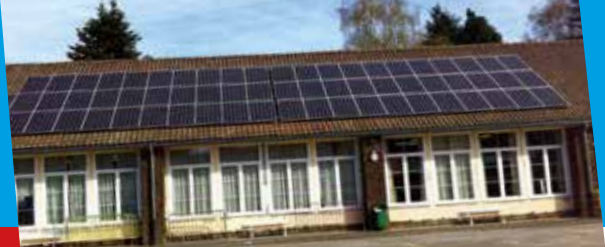
Panneaux photovoltaïques à l'école du Square Larcier Belle évolution dans notre recherche constante d'économie d'énergie au sein de notre Commune