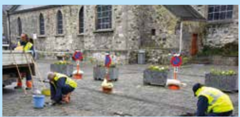
Grand Place : Le stationnement sauvage rendait la Place dangereuse pour les piétons. Le balisage de zones piétonnes leur assurera plus de sécurité. Pour les mêmes raisons, une réfection des pavés a également été entreprise par nos ouvriers communaux.