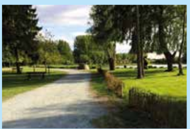
Etangs de Coeurcq : Quelques aménagements réalisés par nos ouvriers communaux en vue d'améliorer les abords de ce merveilleux site.