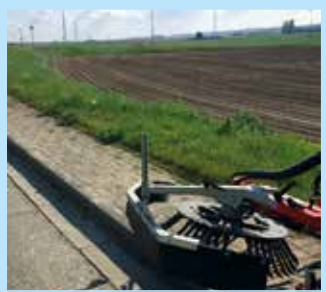
Désherbage mécanique Rue du Try-Haut et à l'Espinette