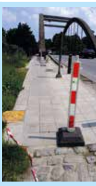
Pont de Clabecq : Dans le cadre de la lutte contre les mauvaises herbes, l'usage d'herbicides étant interdit, nous testons des modes de réfection qui limiteront le développement de la végétation (rejointoiement des dalles, bétonnage des zones en terre, réfection des zones trop abimées, ... )