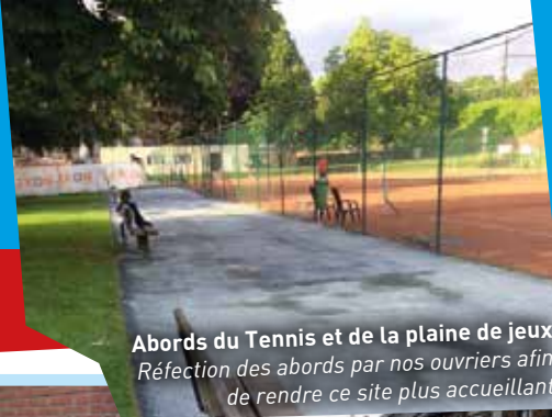
Abords du Tennis et de la plaine de jeux Réfection des abords par nos ouvriers afin de rendre ce site plus accueillant