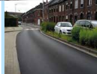
Réfection de la rue des Forges