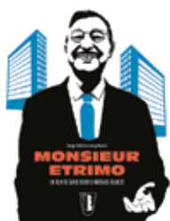
IL AVAIT UN RÊVE: L'HOMME DE CHAIRS BELGE EN PROPRIÉTÉ

PAF : 6€ / 5€ (drink et rencontre inclus)