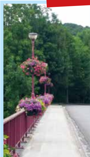
Pont du Canal à Oisquercq La lutte contre les mauvaises herbes est un défi quasi insurmontable depuis l'interdiction de l'usage d'herbicides chimiques. Nous tentons actuellement d'empêcher leur émergence en rejointoyant soigneusement certains espaces publics.