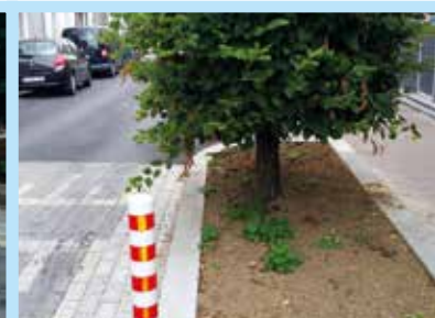
Réfection rue Ferrer (voirie, bacs à fleurs, pose d'une poubelle et d'un cendrier) L'école se situant dans cette portion de voirie méritait bien un réaménagement plus accueillant.