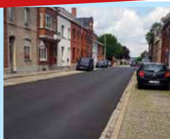
Réfection (phase II) de la rue des Frères Taymans