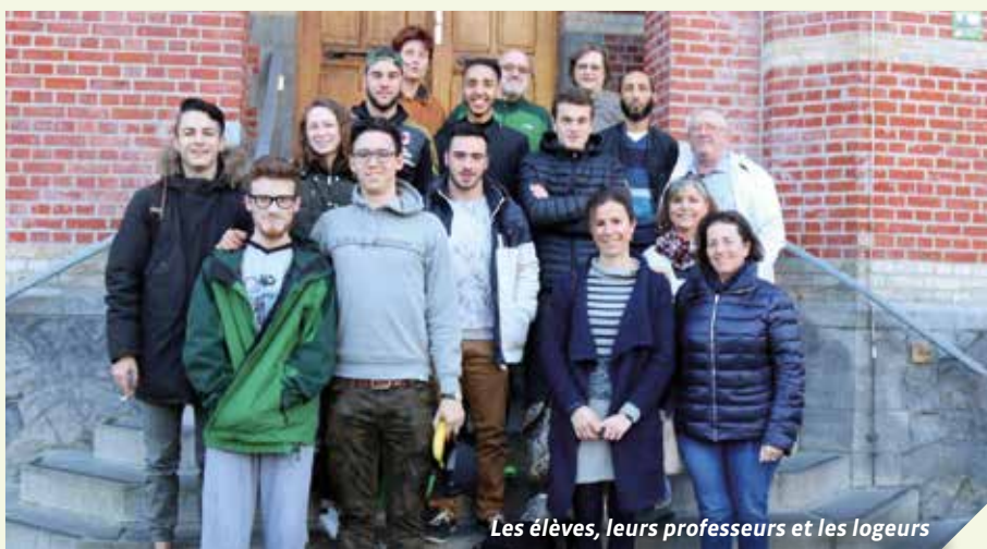
Les élèves, leurs professeurs et les logeurs

Et ce même 26 mars, c'est un groupe de l'I.P.E.S. qui s'en est allé à Mirande, pour y effectuer un stage équivalent.