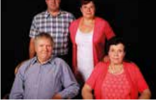
M et M me Haus-Vanbellinhen