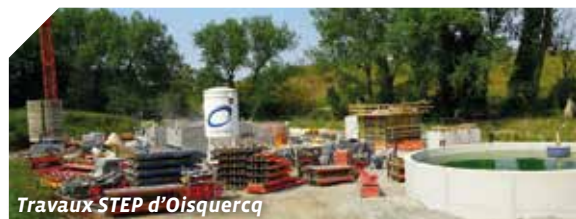
Travaux STEP d'Oisquercq