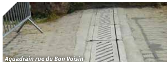
Aquadrain rue du Bon Voisin