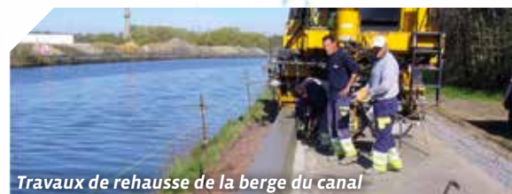
Travaux de rehausse de la berge du canal

Le 28 juin 2016, l'Intercommunale du Brabant Wallon (I.B.W.) a confié à la société Socogetra la construction et la mise en service d'une nouvelle station d'épuration (STEP) à Oisquercq. Située rue d'Oisquercq, celle-ci aura une capacité de 3000 E.H. (Equivalent Habitant). Un an plus tard, ces travaux sont bien avancés. Elle sera opérationnelle au printemps 2018. Les eaux usées d'Oisquercq seront ainsi traitées avant leur rejet dans la Sennette.