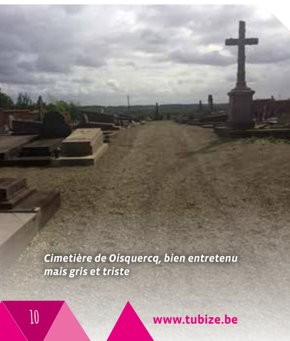
Cimetière de Oisquerq, bien entretenu mais gris et triste

De même, certaines parcelles semblent abandonnées alors qu'elles sont en attente de réaffectation, ce qui peut prendre plusieurs années.