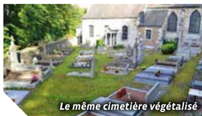
Le même cimetière végétalisé

Demain, il faudra que cela devienne l'affaire de tous.