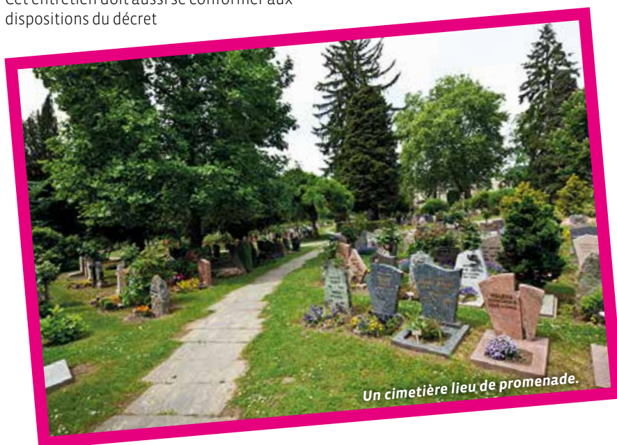
Un cimetière lieu de promenade.

Nous reviendrons sur ce point ultérieurement.