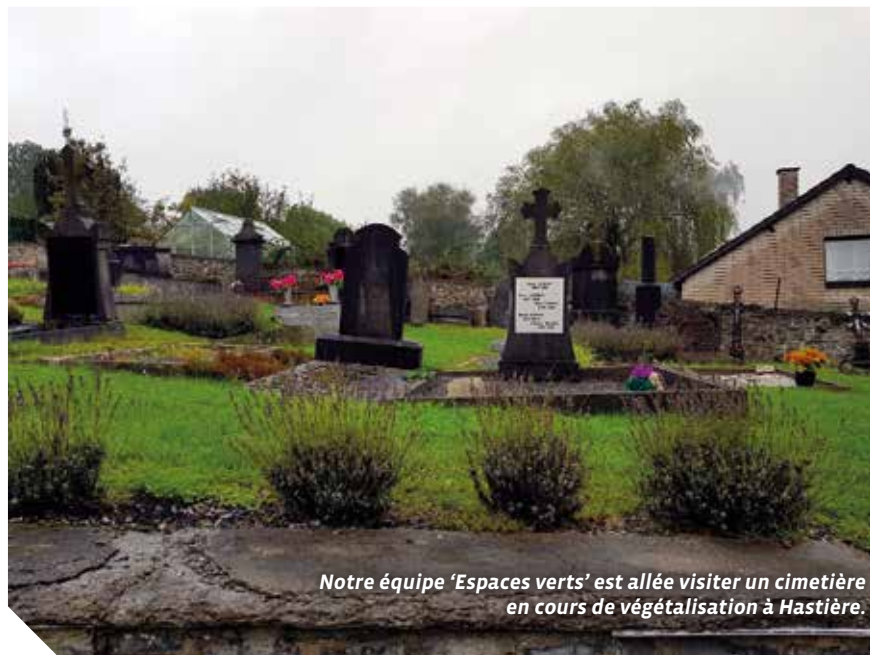
Notre équipe 'Espaces verts' est allée visiter un cimetière en cours de végétalisation à Hastière.

La Ville de Tubize ne compte pas moins de 6 cimetières, ce qui représente près de 71.000 m 2 . L'ampleur de la tâche est donc conséquente d'autant plus que tant les services techniques de la Ville que les citoyens n'y ont pas été préparés. L'équipe en charge de ces entretiens est actuellement constituée de 5 personnes !