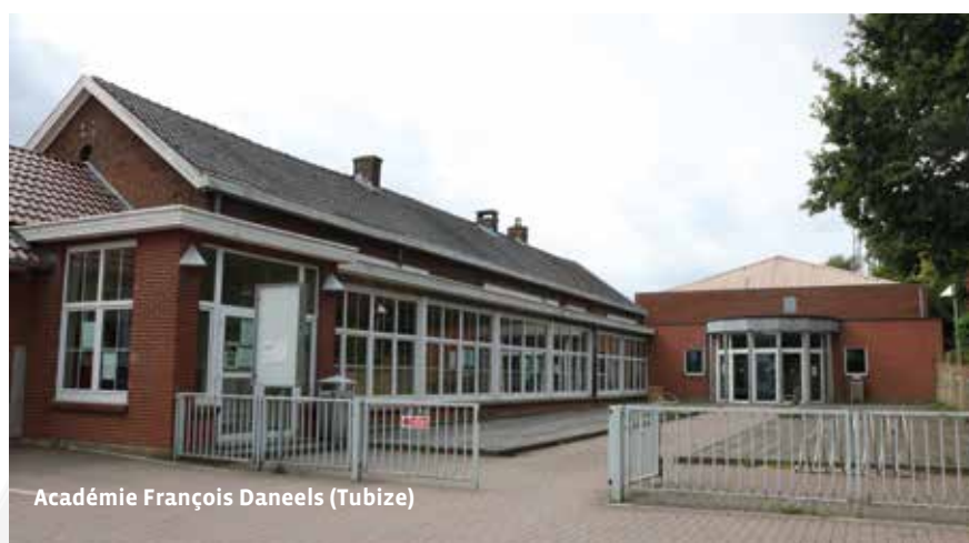
Académie François Daneels (Tubize)