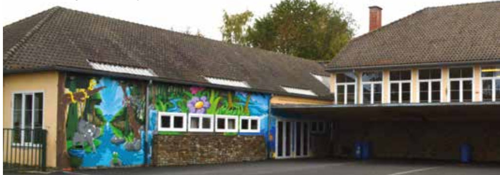
École Cheval Bayard (Clabecq)

Dans nos écoles, chaque élève est considéré dans toutes ses dimensions : sociale, affective, psychologique, motrice et cognitive.