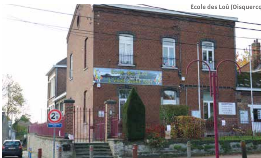
École des Loû (Oisquercq)

Tout comme les autres pouvoirs organisateurs, la Ville a le devoir de répondre aux besoins et aux attentes de la collectivité en matière d'enseignement.