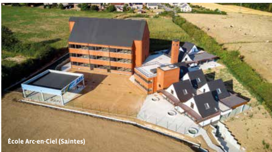
École Arc-en-Ciel (Saintes)

La mission essentielle d'une école communale est de favoriser la cohésion sociale et de développer une culture qui réunit, rassemble les individus dans un esprit de respect mutuel.