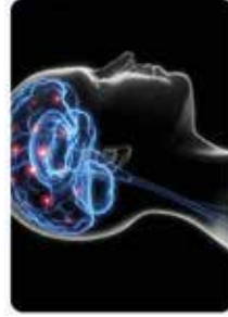
Neuropsychologue & Psychologue