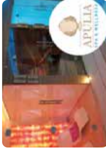
Espace Spa & Wellness, revalidation aquatique & rééducation en piscine