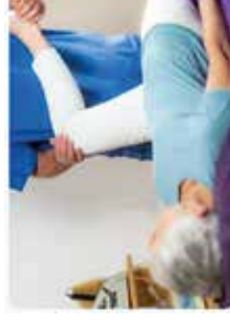
Kinésithérapeutes, coach sportif et revalidation