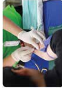
Dispensaire de soins et infirmier(e) à domicile