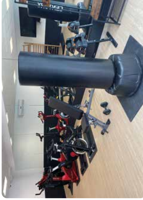
Salle de sport privative :

Abonnement trimestrielle pour un groupe de 1-7 personnes à raison d'une 1 fois par semaine min. Appelez 0473/74.37.29