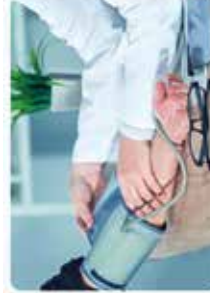
Médecine générale & sportive