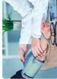
Médecine générale & sportive