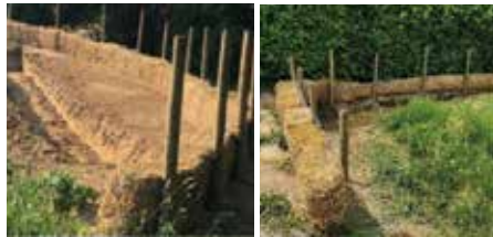
Fascines de paille à Oisquerq et au Merchin à Tubize. D'autres ont été placées à Saintes et au Stierbecq.

Ce sont des barrages filtrant utilisés pour ralentir le flux d'eaux boueuses, sous la forme de barrières épaisses faites de matériel végétal (branchages, paille, copeaux), avec ou sans grillage, maintenu solidement par des piquets.