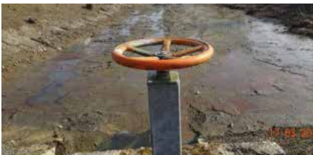
Bassin d'orage du Petit Laubecq. D'autres bassins sont présents dans les parcs d'activités économiques et au sein de certains quartiers résidentiels.

Ils recueillent les eaux pluviales drainées par la voirie, les accotements ou les eaux de ruissellement provenant des champs. Ils peuvent également être réalisés sur un petit cours d'eau avant un passage sous voirie, par exemple afin de limiter le débit sortant.