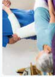
Kinésithérapeute, coach sportif et réhabilitation