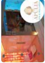
Espace Spa & Wellness, réhabilitation aquatique & rééducation en piscine