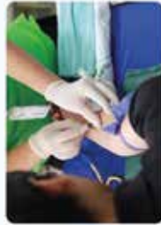
Dispensaire de soins et infirmier(e) à domicile