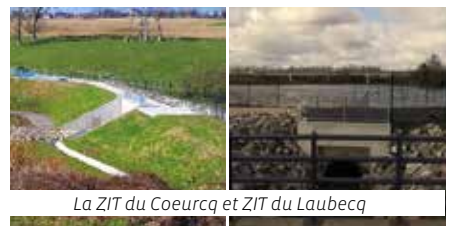
La ZIT du Coeurcq et ZIT du Laubecq

La ZIT fonctionne sur le même principe que la ZEC à la différence qu'à l'aval de la zone se trouve un ouvrage d'art qui permet de réguler le débit sortant via un batardeau, une vanne manuelle ou automatique. Le surplus, resté stocké dans la ZIT, est libéré petit à petit lorsque la crue est passée.