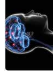
Neuropsychologue & Psychologue