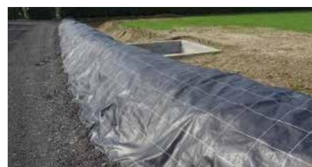
Merlon au quartier du Merchin : levée de terre, éventuellement soutenue par un soutènement pierreux.