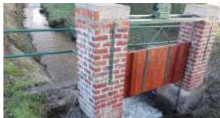
Batardeau aux étangs de Coeurcq : barrage destiné à la retenue d'eau provisoire

Ils sont destinés à la protection contre l'action de la terre ou de l'eau ainsi qu'à la retenue des eaux (barrage, batardeau, digue, gabion, merlon, murs de soutènement, palplanche...):