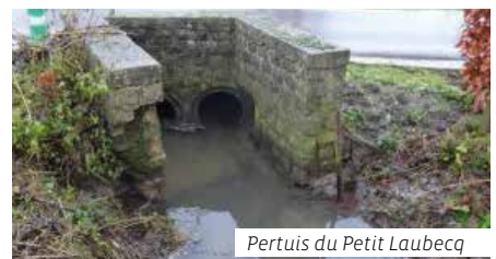
Pertuis du Petit Laubecq

Lieu de passage étroit qui permet aux cours d'eau de passer sous une voirie, de traverser un quartier.