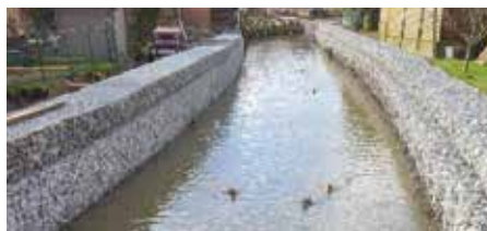
Gabion au quartier du 45 à Clabecq : ouvrage constitué de solides fils de fer tressés et rempli de pierres, généralement utilisé pour construire des berges artificielles ou pour renforcer des berges naturelles.