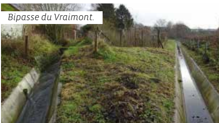
Bypasse du Vraimont.

De l'anglais « by-pass », littéralement « passer au-delà », sont des dispositifs artificiels qui permettent d'effectuer une déviation du cours naturel de l'eau vers un second tracé afin de soulager un endroit sensible.