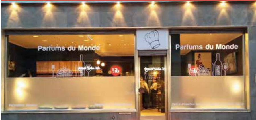
Parfums du Monde, CISP du CPAS de Tubize

Ne perdez pas de temps ! Contactez les au 02/366.02.74.