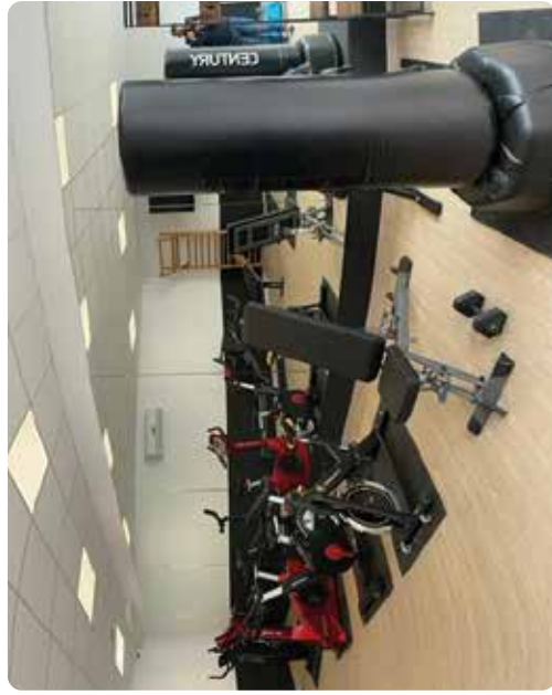
Salle de sport privée : Abonnement trimestriel pour un groupe de 1-7 personnes à raison d'une fois par semaine min. Appelez 0473/74.37.29

Rue de Mons 159 – 1480 Tubize – Tél. 02 355 02 05 – info@espacesantepluriel.be