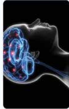
Neuropsychologue & Psychologue