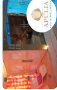
Espace Spa & Wellness, revalidation aquatique & rééducation en piscine