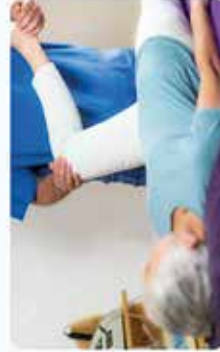
Kinésithérapeute, coach sportif et revalidation