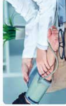
Médecine générale & sportive