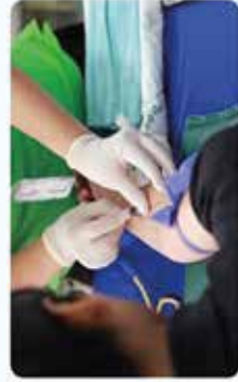
Dispensaire de soins et infirmier(e) à domicile