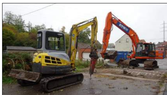
Enlèvement du pont