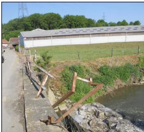
Situation avant travaux