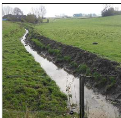
Fossé en amont

Reprise des eaux en amont du chemin de fer par la réalisation d'un fossé et d'un merlon (mai 2014). Travaux réalisés par la Brigade Prévention Inondations.