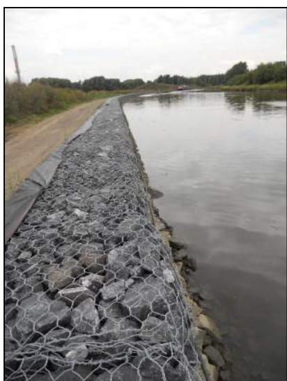
Berges rive gauche