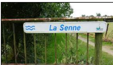
La Senne - avenue de Scandiano et rue de Bruxelles