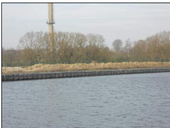
Réfection des berges en rive gauche

Lors des crues de 2010, le Canal Charleroi-Bruxelles a débordé dans les prairies et une partie du quartier du Vraimont à Clabecq mais aussi de l'autre côté du canal vers Tubize. Il est nécessaire de protéger les deux rives du canal en aménageant des digues surélevées sur une longueur d'environ 500 mètres de part et d'autre. Suite à une réunion de travail entre le Bourgmestre, l'Echevin de la Lutte contre les Inondations et le Directeur des voies navigables en avril 2013, les travaux ont été entamés en 2014. La dernière phase (muret de protection) est prévue en 2017 par le S.P.W. (DGO2 – Voies Navigables).