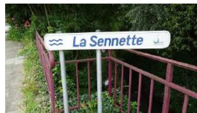
La Sennette - rue de la Déportation