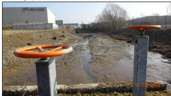
Situation après travaux