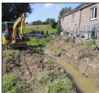
Fossé en aval