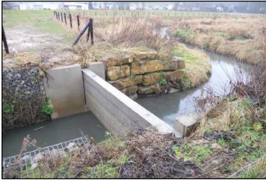
Situation avant travaux