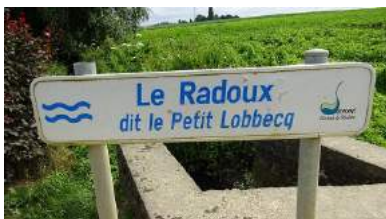
Le Radoux dit le Petit Lobbecq - rue de Tubize