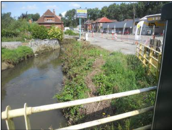
Situation avant travaux