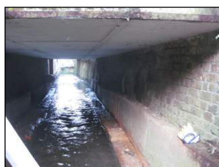
Situation après travaux