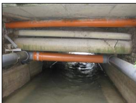
Situation avant travaux