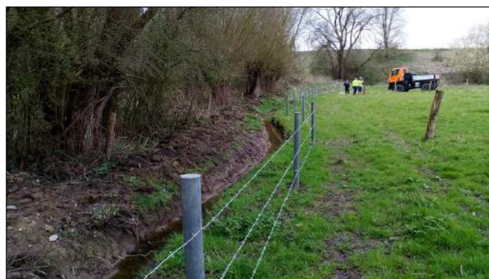
Situation après travaux