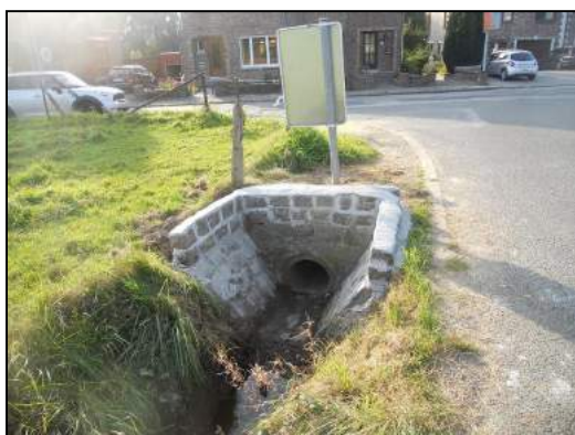
Nouvelle tête d'aqueduc

Le fossé existant a été entièrement curé par la Brigade Prévention Inondations (novembre 2013) et une tête d'aqueduc a été réalisée (septembre 2014) à l'amont du passage sous voirie. Il est envisagé d'y placer des redents afin de ralentir l'écoulement des eaux (en 2017).