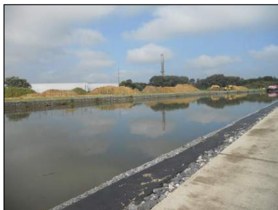
Rehausse des berges en rive droite