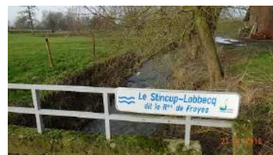
Le Stincup-Lobbecq dit le Rau de Froyes - chemin Vert