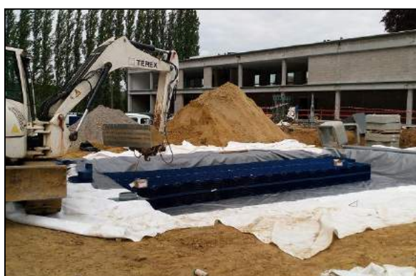
Bassin d'orage du CEFA en structure alvéolaire, une première à Tubize !

La gestion des eaux pluviales est un enjeu important dans la lutte contre les inondations. Avoir une gestion intégrée en essayant "d'infiltrer la goutte d'eau là où elle tombe", de stocker et renvoyer les eaux à faible débit une fois la pluie passée (de préférence dans son milieu naturel) contribue à éviter la surcharge d'eau dans le réseau d'égouttage et à recharger les nappes phréatiques. La Commune de Tubize ainsi que les Communes voisines de Braine-le-Château, Ittre, Rebecq, Braine-l'Alleud et Waterloo, travaillent à la réalisation d'un règlement urbanistique de bonne conduite. Ce travail est coordonné par le Contrat de Rivière Senne et chapeauté par l'Intercommunale du Brabant wallon (I.B.W.) pour la partie technique. Ce règlement devrait être finalisé au premier trimestre 2017.