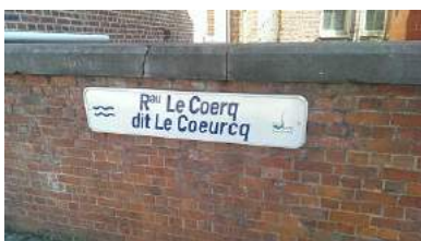
Rau le Coercq dit le Coeurcq - chaussée de Mons & rue des Ponts/rue Reine Astrid