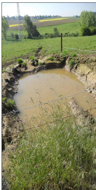
Chemin du Sparou, ouvrage privé