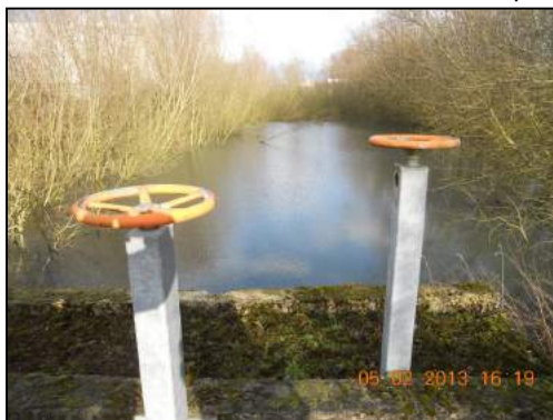
Situation avant travaux