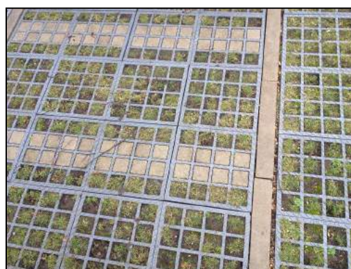
Dalles de parking drainant