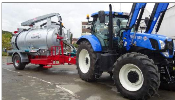
La commune s’est enfin dotée d’une hydrocureuse. Un outil essentiel pour l’entretien préventif de l’égouttage.

Nous tenons à remercier tous ceux qui, d’une manière ou d’une autre, s’impliquent dans notre action de protection et de lutte contre les inondations !