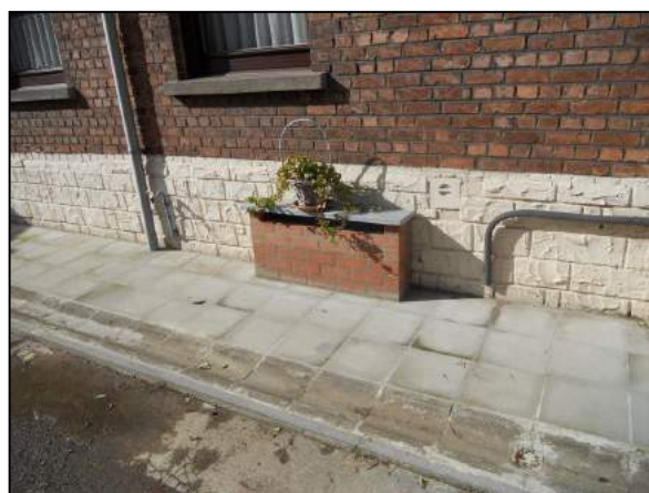
Quelques exemples de travaux réalisés par des riverains du Hain