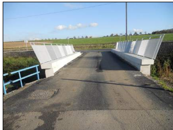
Situation après travaux