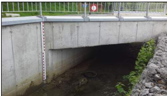
Coeurcq (Complexe sportif Leburton)