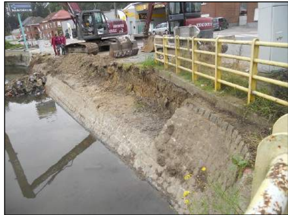
Situation pendant travaux