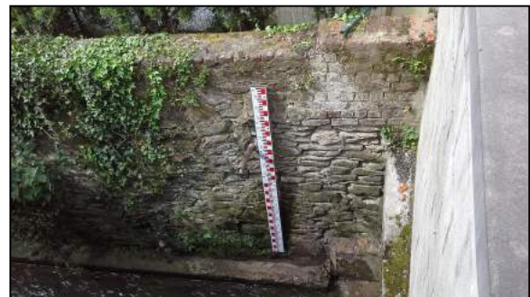
Coeurcq (rue Ferrer)