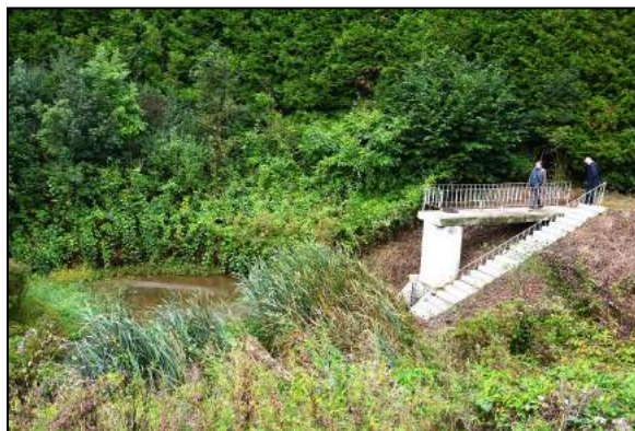
Second bassin + ouvrage avec vanne manuelle