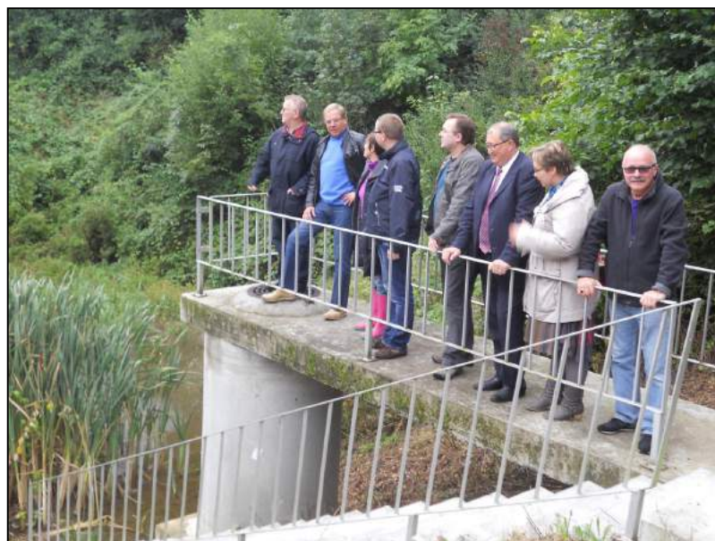
Les « éclaireurs » en formation au bassin d'orage de l'avenue de Mirande