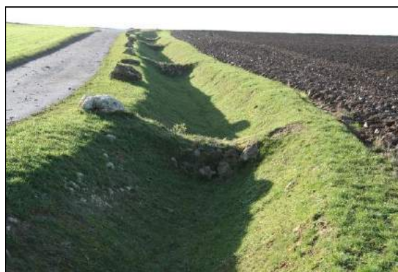
Fossé à redents