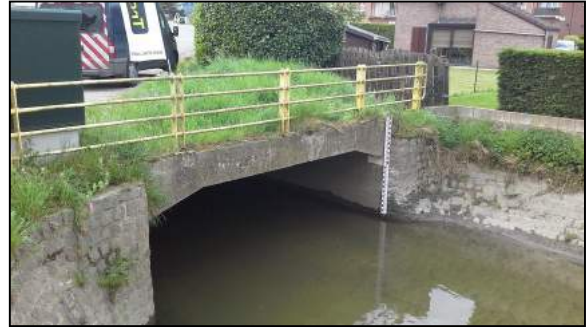
Hain (« TROC »)