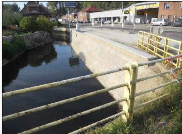
Situation après travaux