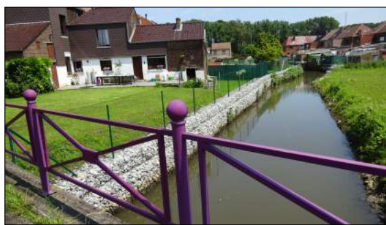
Situation après travaux