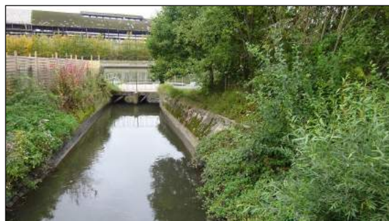
Situation avant travaux