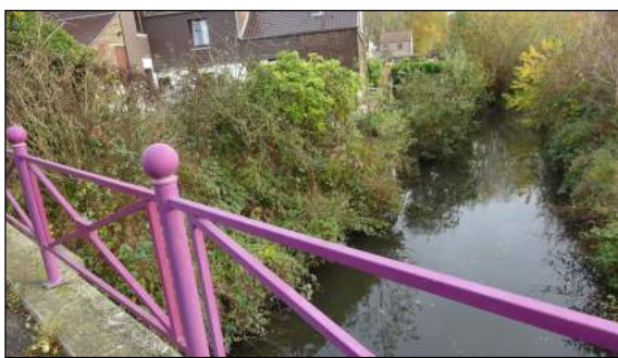
Situation avant travaux