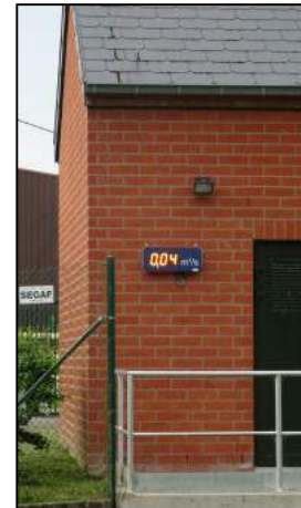
Affichage électronique STEP I.B.W.