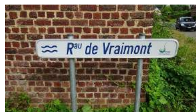
Rau de Vraimont - rue des Déportés