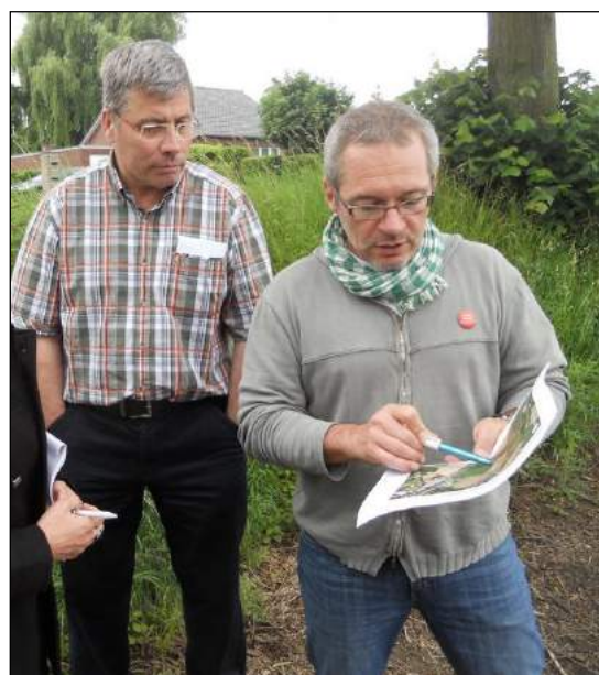
Etudes sur le terrain avec un des propriétaires et le GISER (Gestion Intégrée Sol-Erosion-Ruissellement – S.P.W.)