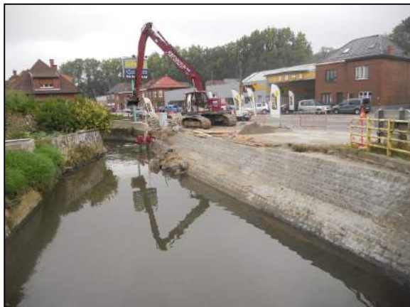
Situation pendant travaux