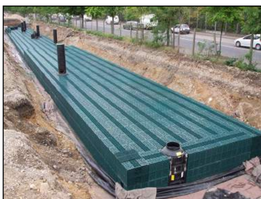
Chaussée à structure réservoir