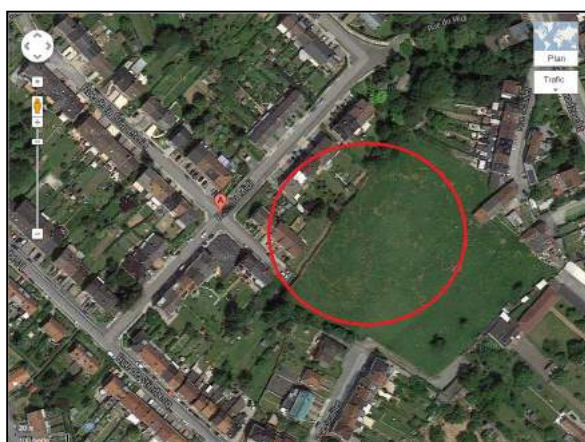
Situation rue de la Briqueterie