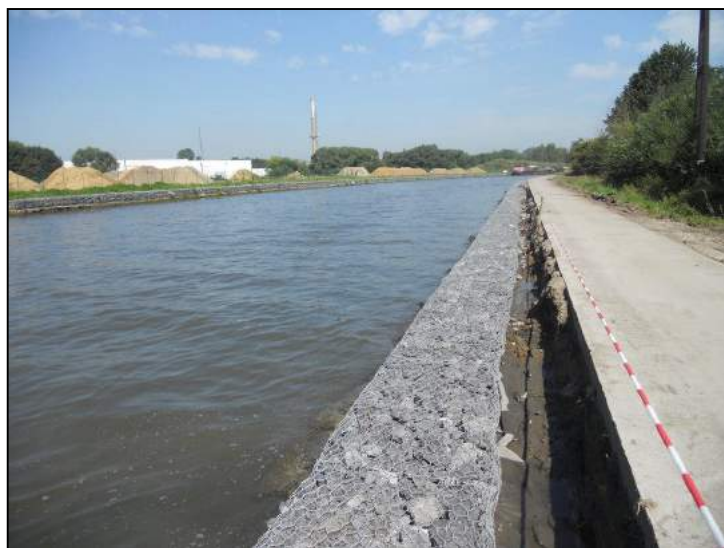
Berges rive droite