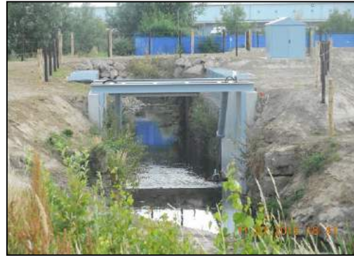
Nouvelle vanne automatique