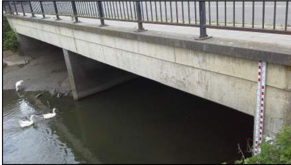
Senne (rue de Scandiano)

En association avec le S.P.W., ces échelles de crue ont été placées en juin 2015 afin de faciliter l'observation du Service Incendie ainsi que du groupe des éclaireurs constitué de Conseillers communaux.