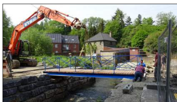
Pose de la passerelle cyclo-piétonne