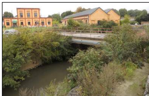
Pont actuel (2016)