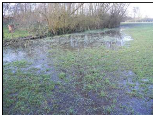
Situation avant travaux