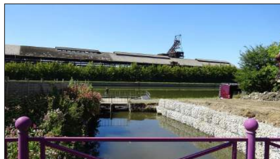
Situation après travaux (phase 1)